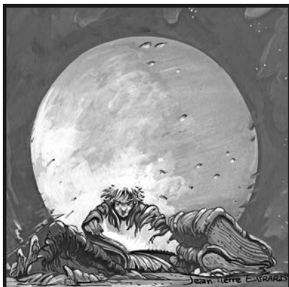
Illustration couverture Jean-Pierre Evrard

Nous tenons à remercier Jean-Pierre Evrard pour l'autorisation de reproduction d'une de ses oeuvres.